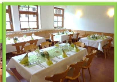
Haus Tabor- Raum Gartenblick